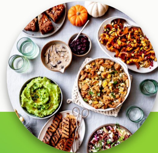
Kundenwunsch nach Diversifizierung im Angebot