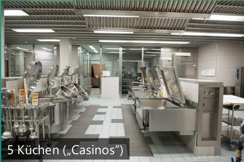
5 Küchen („Casinos“)