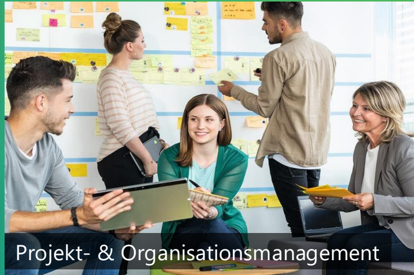
Projekt- & Organisationsmanagement