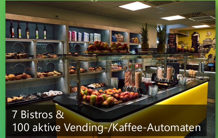
7 Bistros & 100 aktive Vending-/Kaffee-Automaten